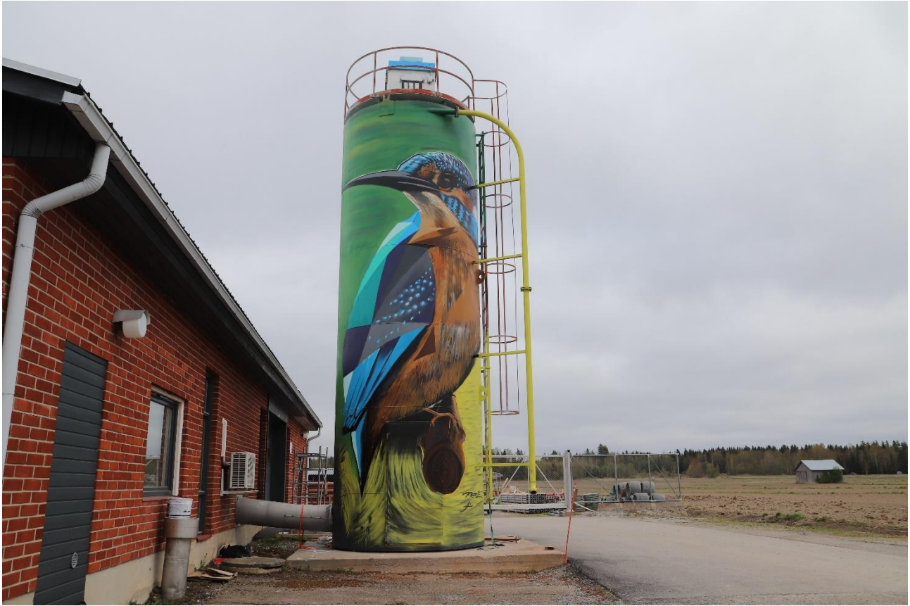
Frode & Kyösti Linna: Katso merta (titta på havet), 2021. Åminnevägen 130, Malax.