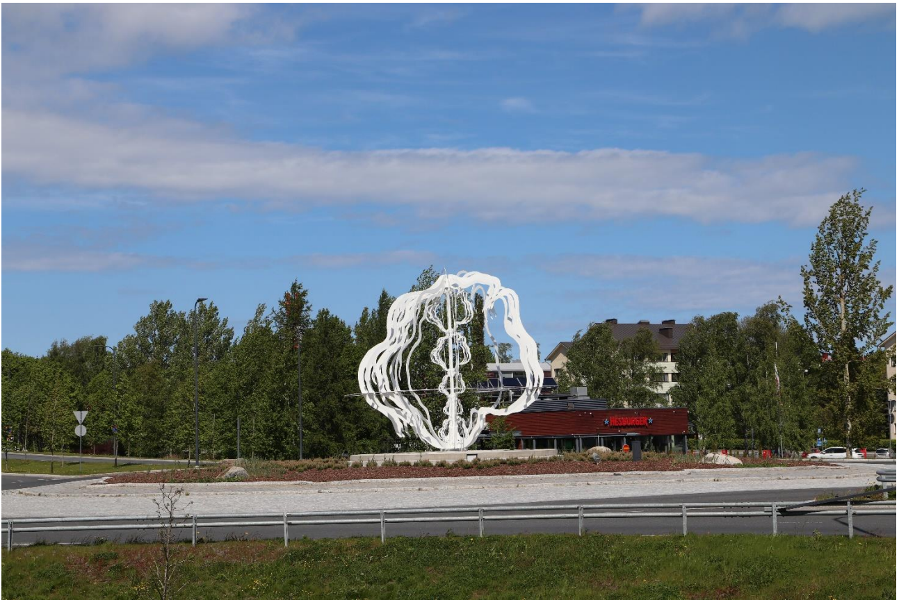
Kirsi Kaulanen: De Geer, 2021. Sandvikens rondell, Vasa.