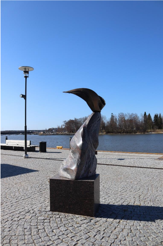
Laila Pullinen: Sibylla, 2003. Inre hamnen, Vasa.