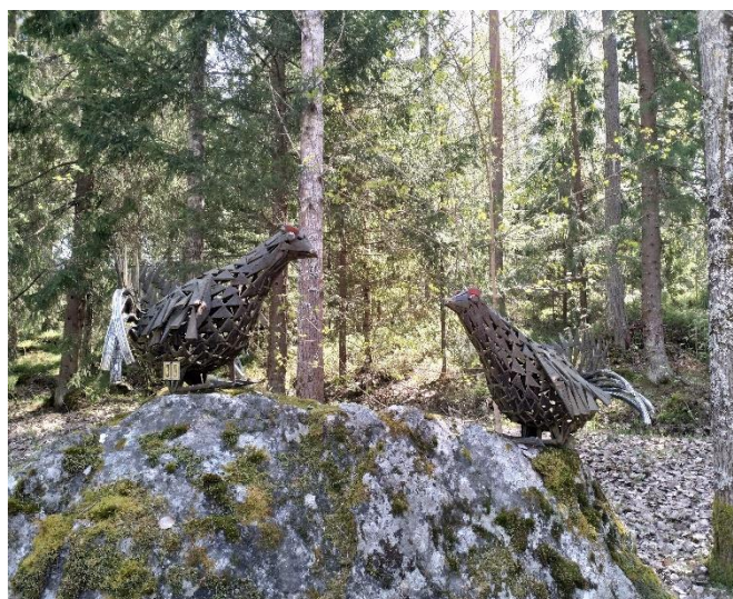
Edvin Hevonkoski. Edvinsstigen, 1981. Vapenbrödrabyns motionsstig, Vasa.