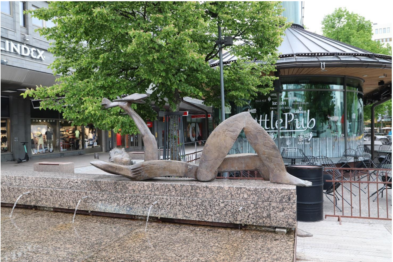
Erkki Kannosto. Resfeber, 2005. Hovrättsplanaden, Vasa.