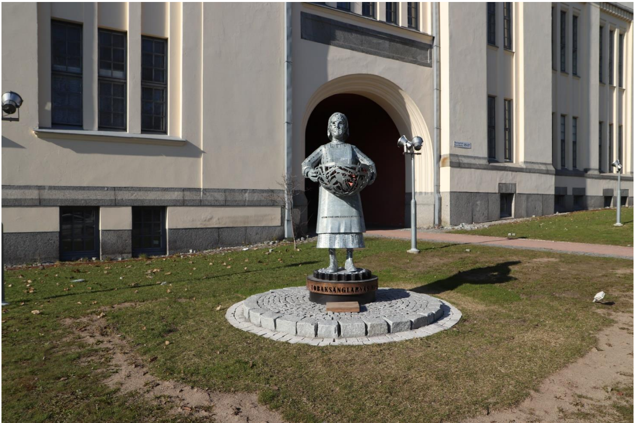
Tiina Torkkeli: Tobaksängeln, 2022. Skolgatan 25, Jakobstad.