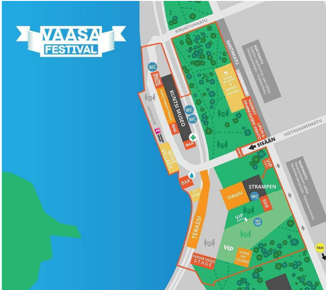
Tapahtuma-alueen suunnitelma 2026, alue on samanlainen kuin vuosina 2024 sekä 2025.

Ulkopuolinen asiantuntija seuraa melutasoja säännöllisin mittauksin. Mittauksia tehdään kaikkina päivinä koko tapahtuman ajan. Mittauspisteen tulee sijaita paikassa, johon ääni meluselvityksen mukaan kuuluu esteettömästi ja lisäksi huomioiden festivaalin aikana vallitsevat sääolosuhteet. Ulkopuolisen asiantuntijan tulee tehdä mittauksia myös alueen ulkopuolelta.