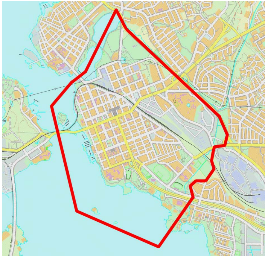
Kaava-alueen alustava rajausta.

Osayleiskaava-alue muodostuu Vaasan keskusta-alueesta, mukaan lukien Onkilahden kaakkoisranta, hautausmaa-alue, Hietasaari, Hietalahden ranta ja urheilupuisto, Kuparisaari, Etelä-Klemettilä ja Pohjois-Klemettilä sekä Vöyrinkapunki. Alueen pinta-ala on noin 9,5 km 2 , josta vesialuetta on noin 3 km 2 .