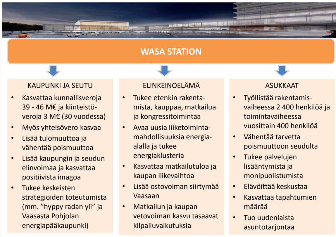
Kuva 4. Wasa Stationin vaikutuksia.