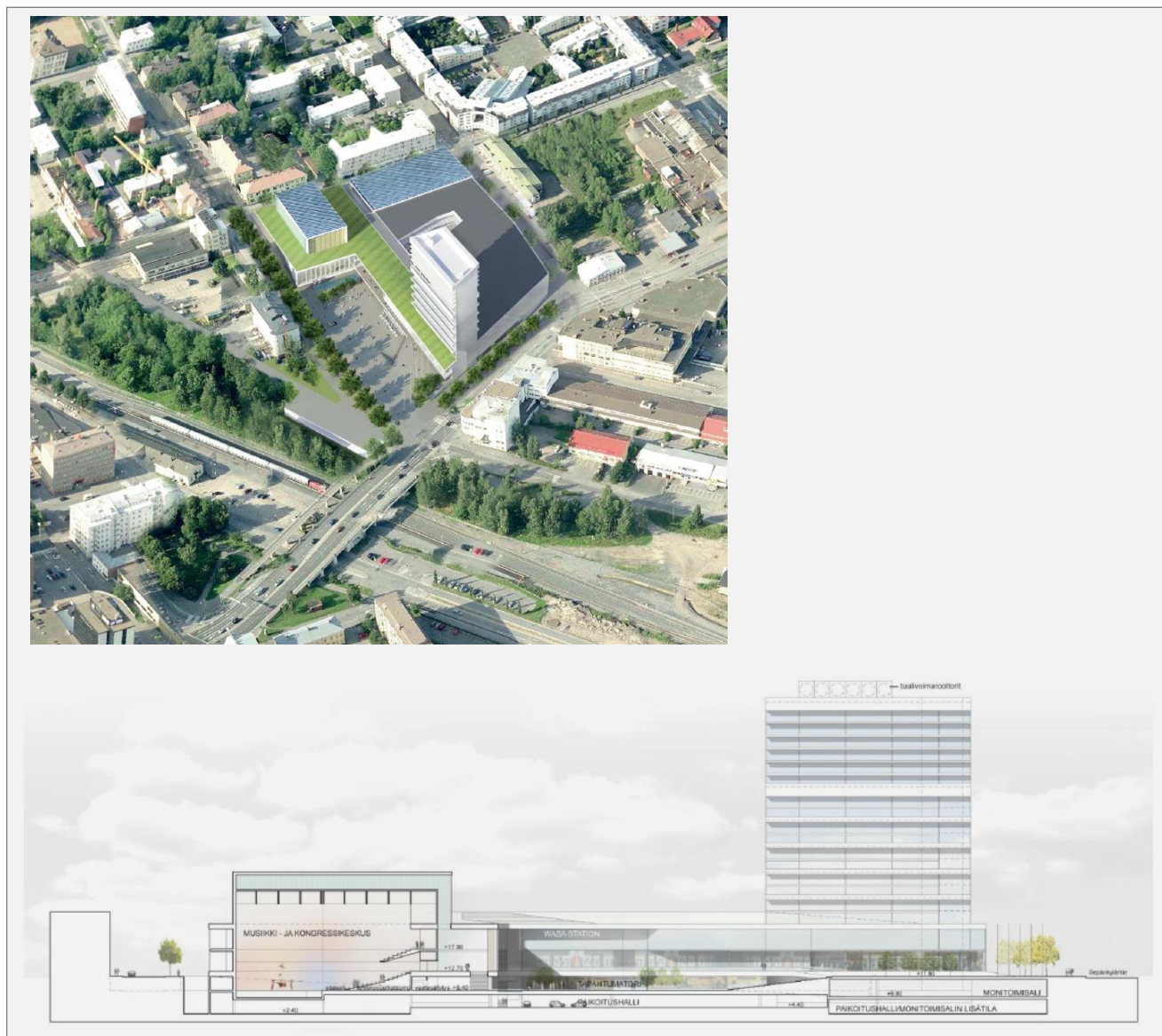
Kuva 2. Wasa Stationin havainne- ja rakennekuva (Lemminkäinen/Arosuo Arkkitehdit 2014).

Kauppakeskuksen myymälä-, ravintola- ja kahvilatilat ovat rakennuksen kolmessa ensimmäisessä kerroksessa. Kauppakeskukseen on suunniteltu sijoittuvaksi kooltaan noin 2 000 k-m 2 :n päivittäistavaramyymälä sekä erikoistavarakaupan myymälöitä (mm. pukeutumisen, vapaa-ajan, sisustamisen sekä kauneuden ja terveyden alojen erikoisliikkeitä). Kolmannen kerroksen liiketilat voivat toimia myös erilaisina toimistohotelleina. Asuinhuoneistot (40 kpl) ovat torniosan ylimmissä kerroksissa (16 - 23). Asuntojen yhteis- ja ulko-oleskelutilat muodostuvat uima-allas-, saunaosasto-, terassi- ja kattoterassikerroksista. Maan alle tulee yli 600 auton paikoitushalli.