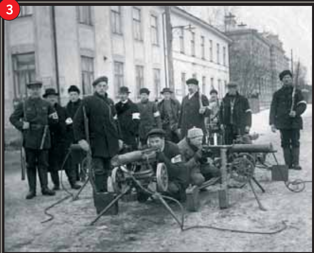
Kulspruta i hörnet av Rådhusgatan och Fredsgatan.