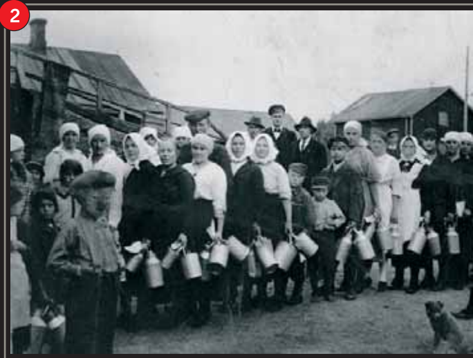
Mjölkkö under kristiden.