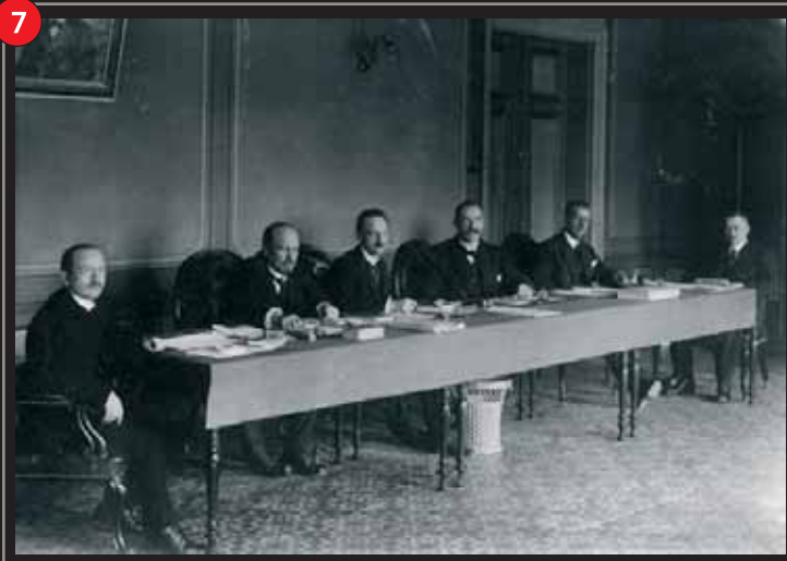
Finlands senat sammanträder i tadshuset.