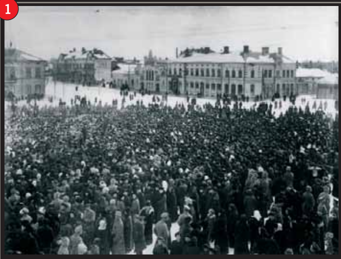
Marsrevolutionen firas på Vasa torg.

Klockan tre på natten den 28 januari 1918 inleddes avvärjningen av de ryska trupperna i Vasa. De hårdaste striderna gällde kasernen på Rådhusgatan. I hörnet av Rådhusgatan och Fredsgatan fanns totalt tre kanoner och fyra kulsprutor, som var riktade mot arbetarföreningens hus, nuvarande stadsteatern, och kasernen (Rådhusgatan 33). Även framför stadshuset stod kanoner och ammunitionsvagnar.