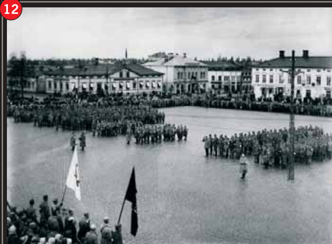
Parad i Vasa 20.5.1918 efter krigsslutet.