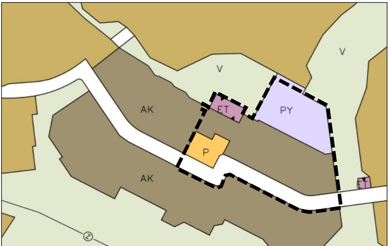
Ote Vaasan yleiskaavasta 2030.

Kaupunginvaltuuston 13.12.2011 hyväksymässä Vaasan yleiskaavassa 2030 suunnittelualue on osoitettu asuinkerrostalojen alueeksi (AK), julkisten palvelujen ja hallinnon alueeksi (PY) ja yhdyskuntateknisen huollon alueeksi (ET).