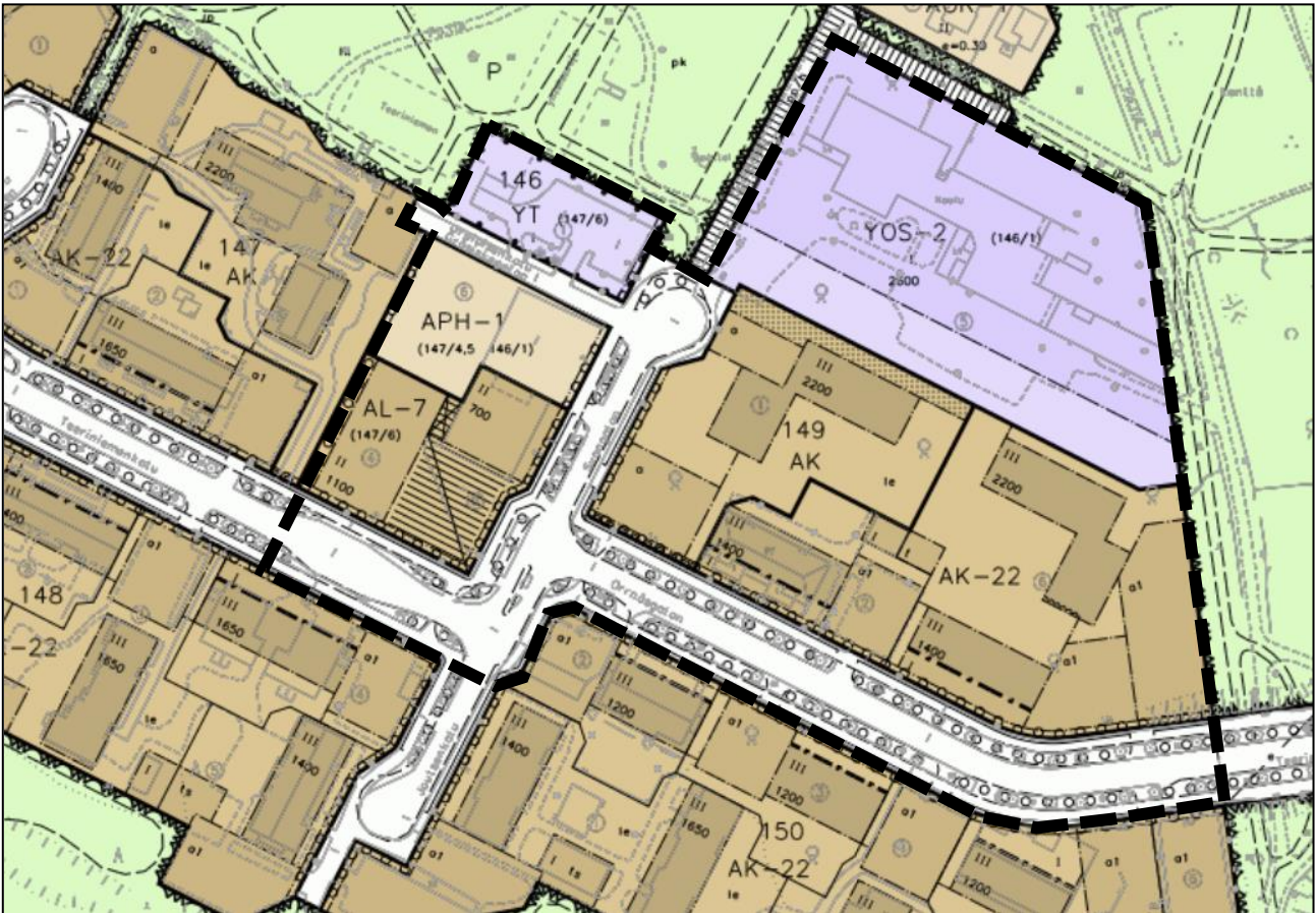
Ote Teeriniemen kaupunginosakeskuksen ajantasa-asemakaavasta.

Ajantasa-asemakaavassa kaava-alue koostuu asuinkerrostalojen korttelialueista (AK ja AK-22), liikerakennusten korttelialueesta (AL-7), autojen säilytykseen ja pysäköintiin varatusta korttelialueesta (APH-1), opetus- ja sosiaalista toimintaa palvelevien rakennusten korttelialueesta (YOS-2), kunnallisteknisten rakennusten ja laitosten korttelialueesta (YT) sekä katualueista.