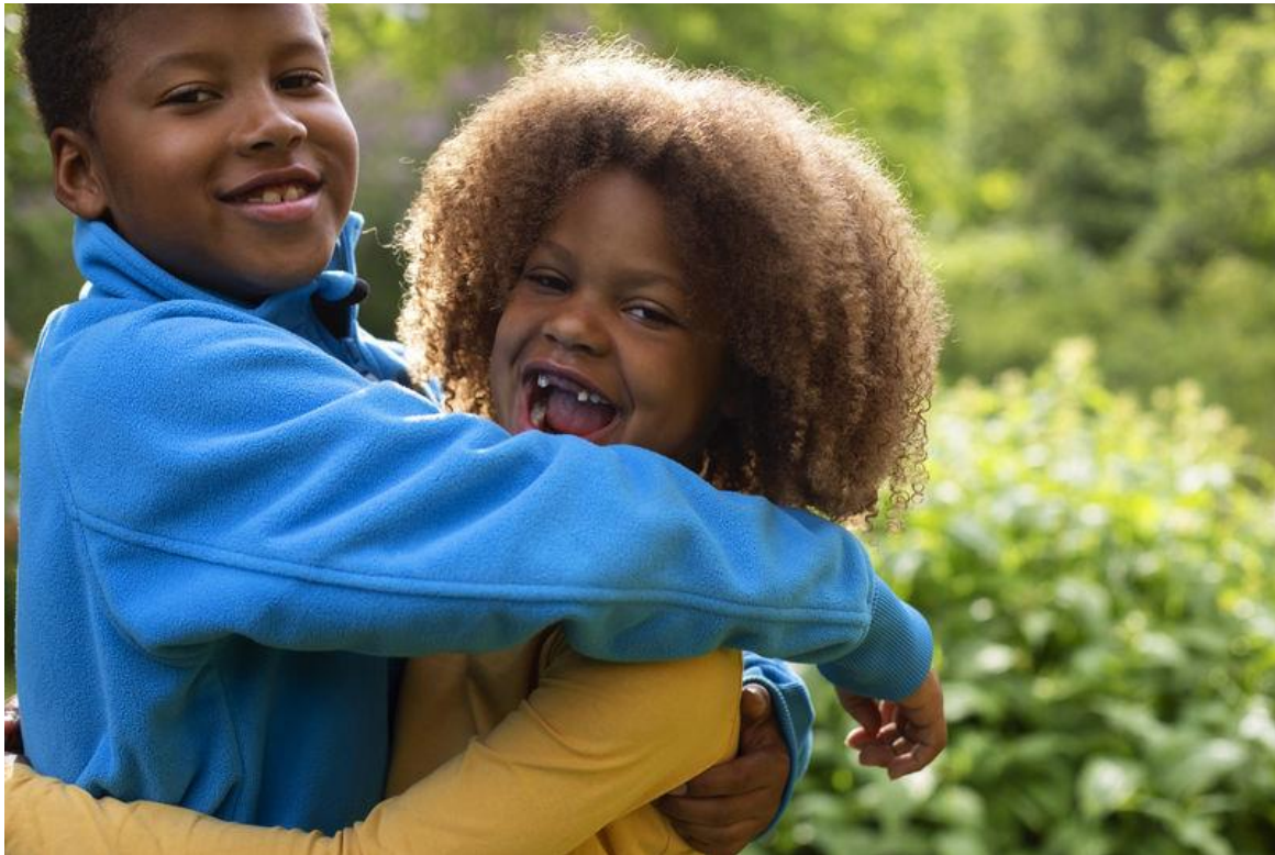
Kuva 23. Kaksi lasta halaa toisiaan