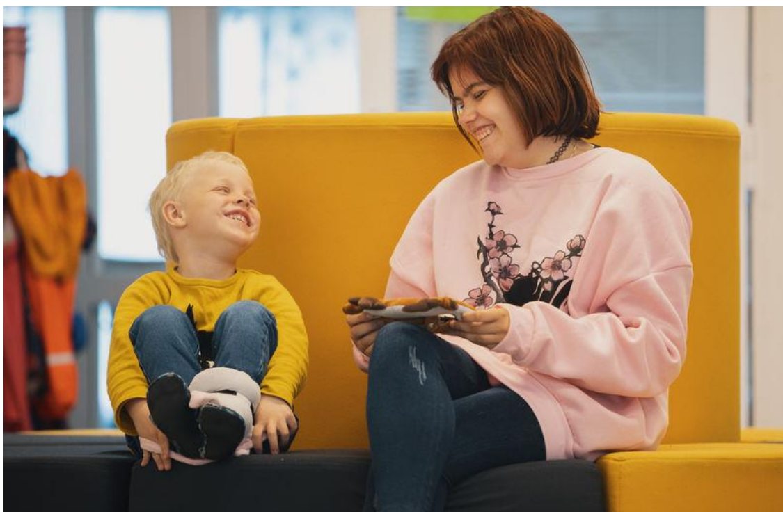
Kuva 28. Lapsi ja aikuinen istuvat sohvalla. He hymyilevät toisilleen.