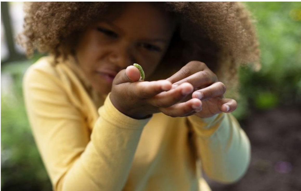
Kuva 18. Lapsi tutkii sormellaan olevaa vihreää matoa.

Erilaisilla harjoituksilla tuetaan lasten tilan ja tason hahmottamista. Lapsia kannustetaan tutkimaan kappaleita ja muotoja sekä leikkimään niillä. Lasten geometrisen ajattelun vahvistamiseksi heille järjestetään mahdollisuuksia rakenteluun, askarteluun ja muovailuun. Aikakäsitettä avataan esimerkiksi vuorokauden- ja vuodenaikojä havainnoimalla.