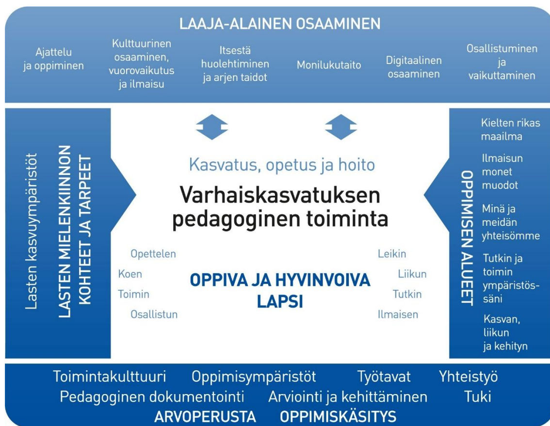
Kuva 10. Varhaiskasvatuksen pedagogisen toiminnan viitekehys

Varhaiskasvatuksen pedagogista toimintaa ja sen toteuttamista kuvaa kokonaisvaltaisuus. Tavoitteena on edistää lasten oppimista ja hyvinvointia sekä laaja-alaista osaamista (kuvio 1). Pedagoginen toiminta toteutuu lasten ja henkilöstön välisessä vuorovaikutuksessa ja yhteisessä toiminnassa. Lasten omaehtoinen, henkilöstön ja lasten yhdessä ideoima sekä henkilöstön suunnittelema toiminta täydentävät toisiaan. Varhaiskasvatuksen pedagoginen toiminta läpäisee kasvatuksen, opetuksen ja hoidon kokonaisuuden.