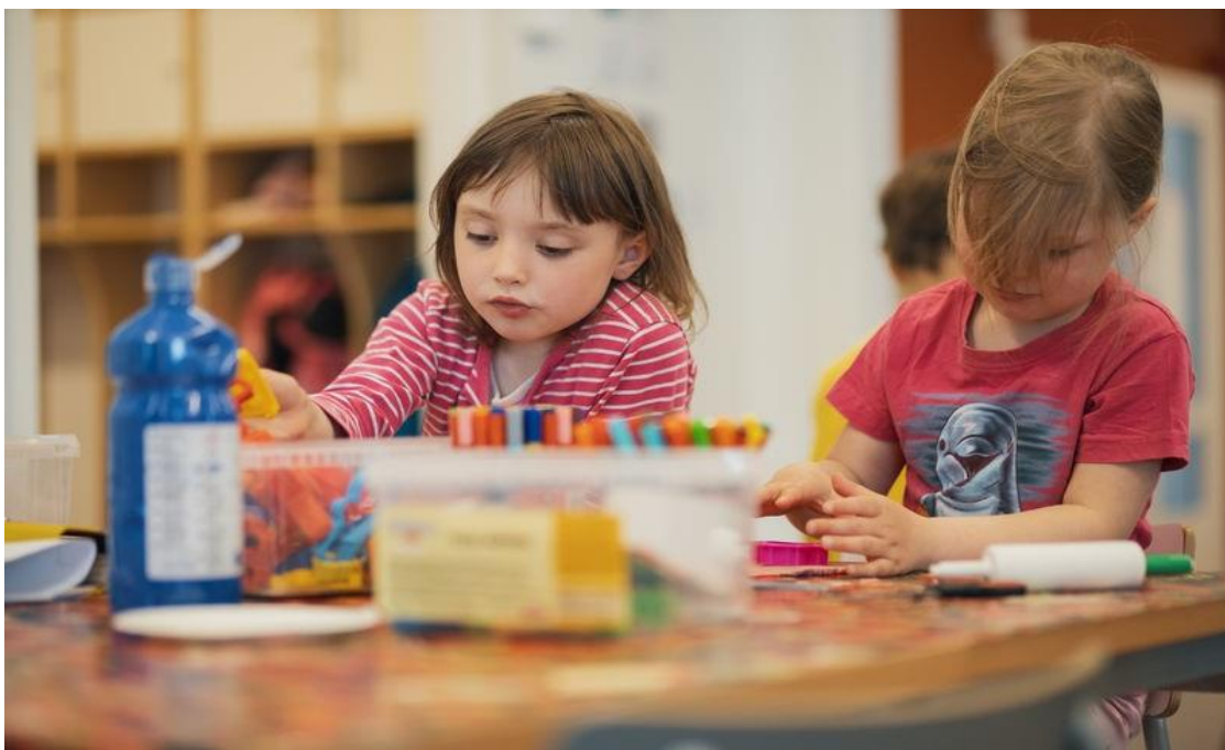
Kuva 11. Kaksi lasta istuu pöydän ääressä. He leikkivät muovailuvahalla.

näkyväksi tekemiseen lapsille, henkilöstölle ja huoltajille. Lisäksi se toimii huoltajien kanssa käytävien keskustelujen perustana ja tukena.