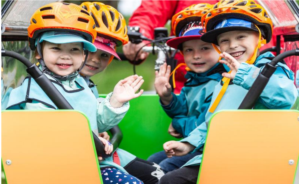
Kuva 29. Neljä iloista lasta istuu muksubussin kyydissä. He vilkuttavat.