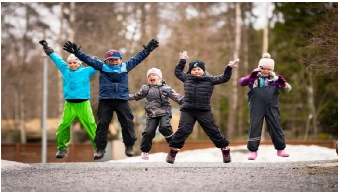
Kuva 6. Lapset hyppivät ilmaan ulkona

lapsella on mahdollisuus osallistua ja vaikuttaa. Osallistumisen ja vaikuttamisen kautta lasten käsitys itsestään kehittyi, itseluottamus kasvaa ja yhteisössä tarvittavat sosiaaliset taidot muovautuvat.