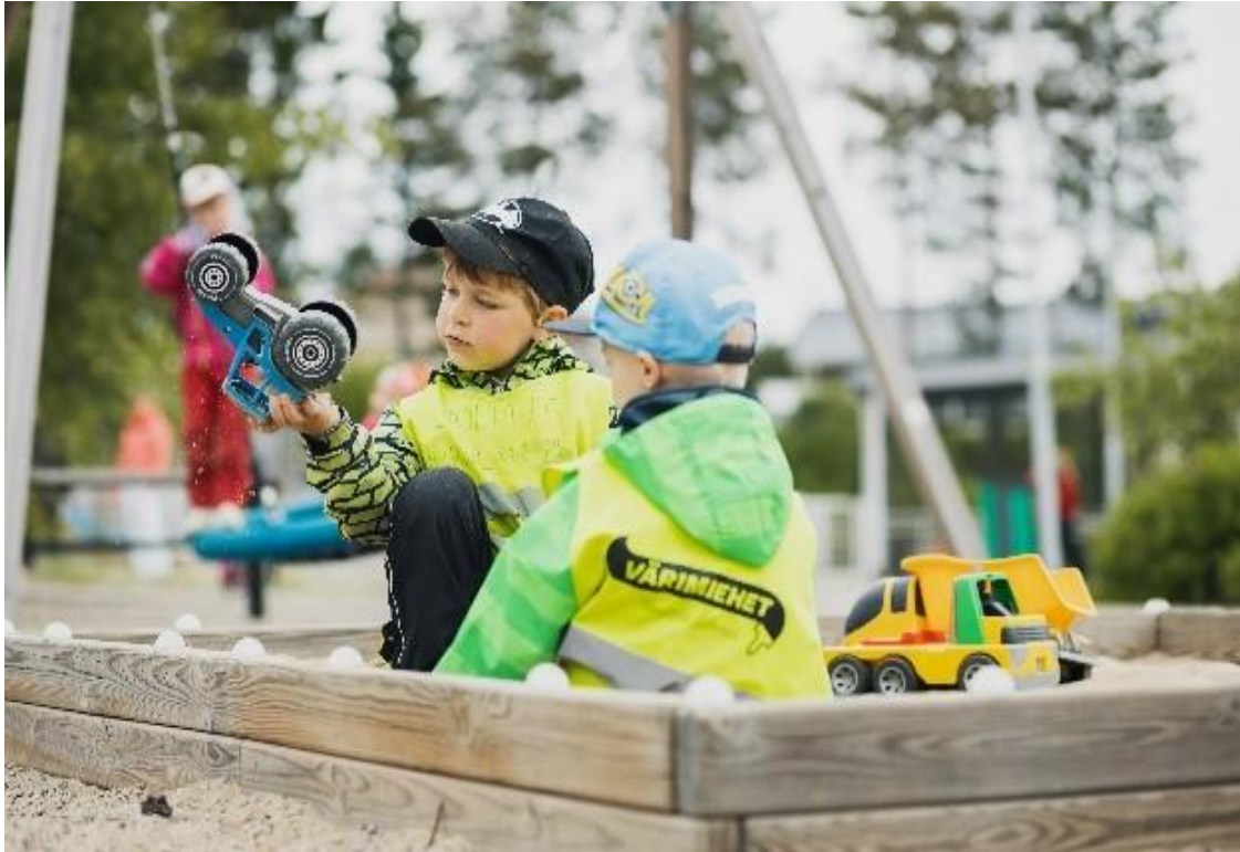
Kuva 17. Kaksi lasta hiekkalaatikolla. He leikkivät traktorilla.