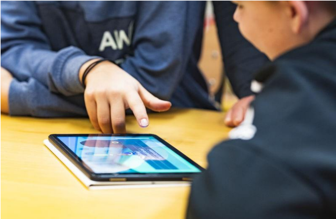
Kuva 16. Lapset leikkivät lukulaitteella.