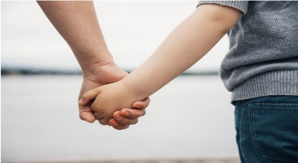
Kuva 9. Aikuinen ja lapsi pitävät toisiaan kädestä kiinni. Kuva otettu takaapäin.