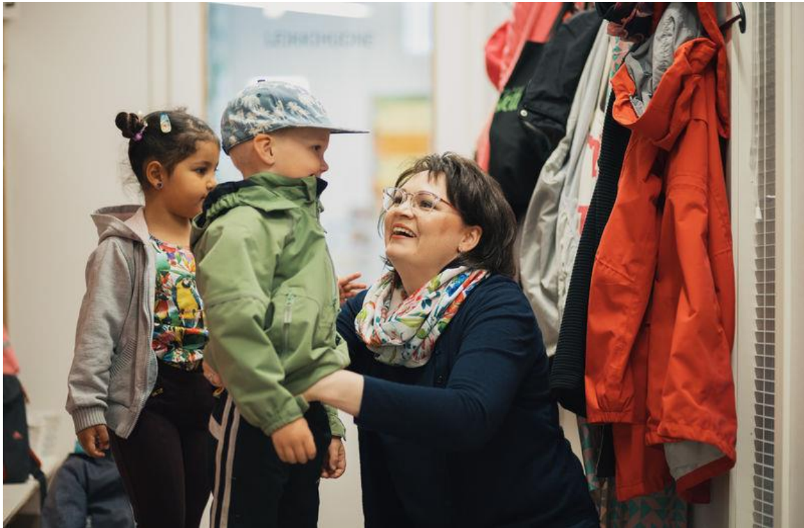
Kuva 24. Kaksi lasta ja aikuinen ovat pukemassa päiväkodin eteisessä. Aikuinen auttaa toista lasta.