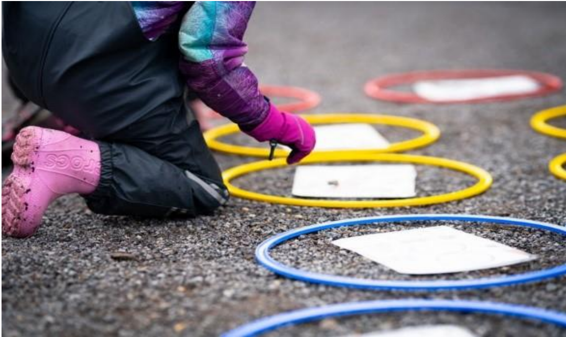
Kuva 5. Lapsi on kyykistynyt maahan tekemään tehtäviä.