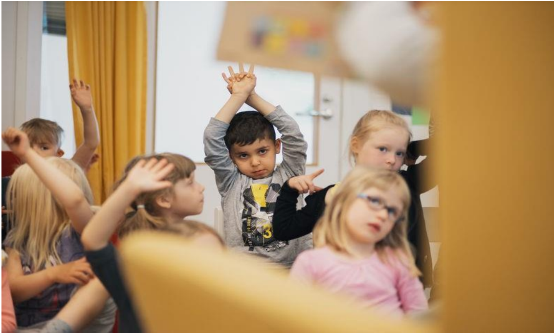
Kuva 7. Kuvassa kuusi lasta, joista osa viitta käsipystyssä.