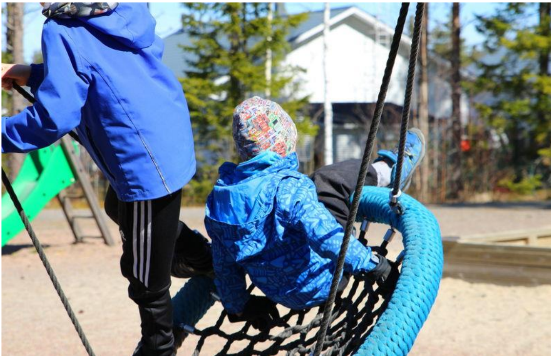
Kuva 25. Kaksi lasta keinuu hämähäkkikeinussa.

Vaasassa tuen tarpeen suunnittelun ja toteutuksen apuna voidaan käyttää tuen muotojen tarkistuslistaa. Lapsen tuen tarpeista keskustellaan tarvittaessa huoltajien, henkilökunnan ja muiden asiantuntijoiden kanssa ja tuki dokumentoidaan lapsen varhaiskasvatussuunnitelmaan. Kasvatushenkilöstön erilainen osaaminen ja käytössä olevat resurssit hyödynnetään. Tukea suunniteltaessa otetaan huomioon lapsen osallisuus ja oikeus oppia ja toimia osana vertaisryhmää samassa tilassa ja toiminnassa muun lapsiryhmän kanssa.