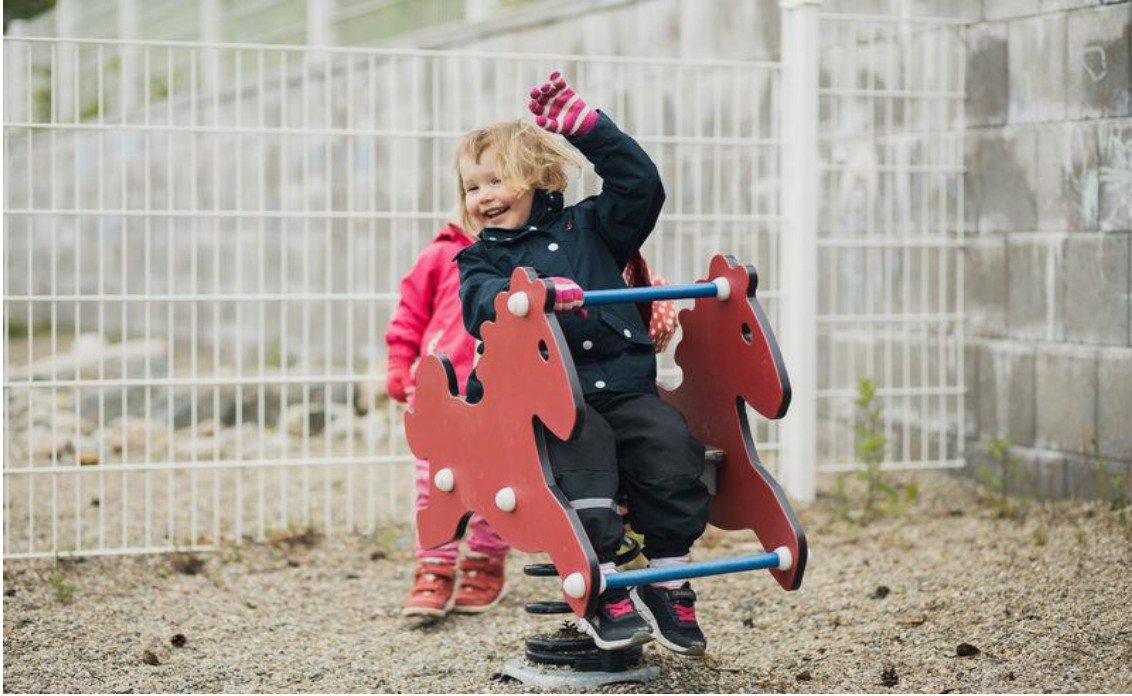
Kuva 22. Lapsi istuu pihalla pomppukeinussa. Hän hymyilee ja vilkuttaa toisella kädellä.