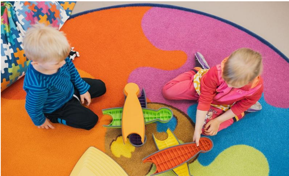
Kuva 8. Kaksi lasta rakentelee lattialla isoilla palikoilla värikkään maton päällä.

Kaikessa toiminnassa huomioidaan ekologisesti, sosiaalisesti, kulttuurisesti ja taloudellisesti kestävä elämäntavan välttämättömyys. Arjen valinnoilla ja toimilla ilmennetään vastuullista suhtautumista luontoon ja ympäristöön. Varhaiskasvatuksessa edistetään välineiden ja tilojen yhteiskäyttöä, kohtuullisuutta, säästäväisyyttä, korjaamista ja uusiokäyttöä.