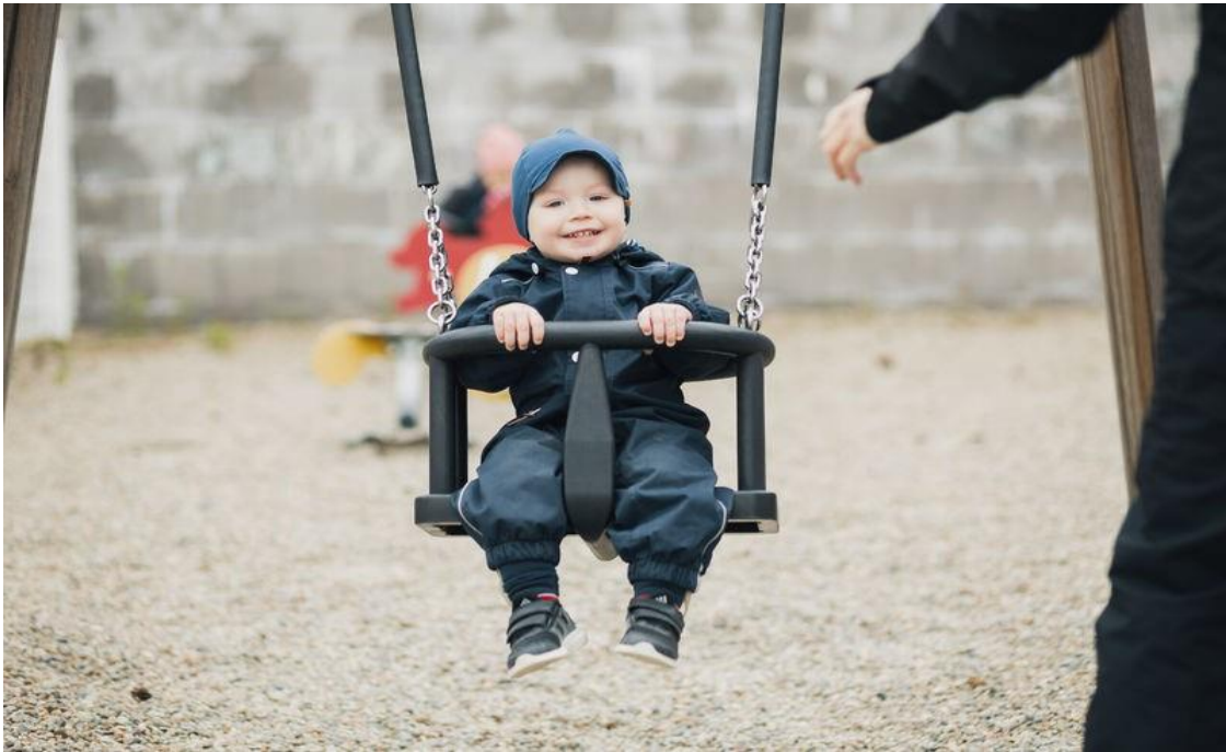
Kuva 2. Pieni poika keinuu vauvakeinussa.