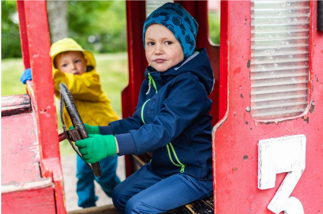
Kuva 26. Kaksi lasta leikkii ulkona isossa puuautossa. Toinen lapsi ohjaa ratista leikkiautoa ja toinen seisoo auton oviaukon vieressä.