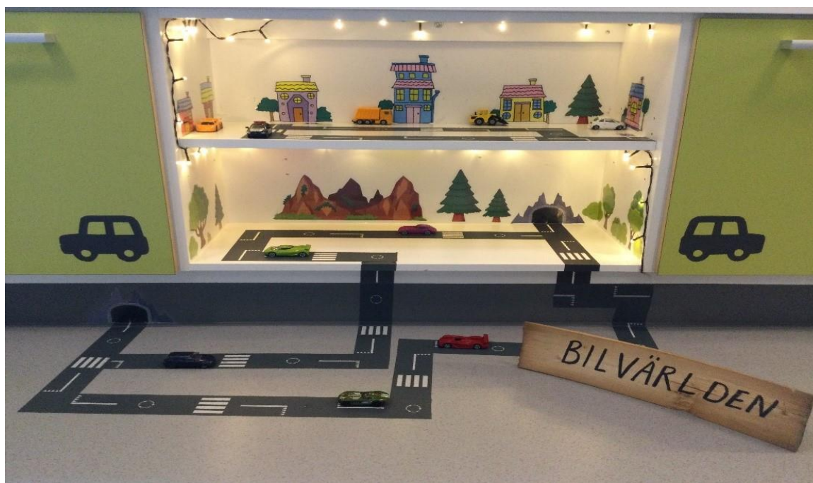
Kuva 12. Lattialle ja hyllylle rakennettu leikkipaikka, jossa valaistu autorata.

Lasten kulttuurin ja lapsille suunnatun median tunteminen auttaa henkilöstöä ymmärtämään lasten leikkejä. Myös erilaiset pelit sekä digitaaliset välineet ja sovellukset tarjoavat niihin monenlaisia mahdollisuuksia. Leikkiin kannustavassa oppimisympäristössä myös aikuinen on oppija. Henkilöstö keskustelee leikin merkityksestä ja lasten leikkeihin liittyvistä havainnoista huoltajien kanssa. Tällä tavoin voidaan edistää leikkien jatkumista kotona tai varhaiskasvatuksessa.