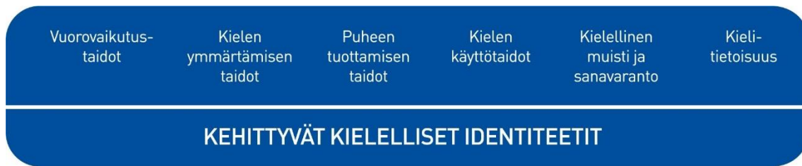
Kuva 13. Lasten kielen kehityksen keskeiset osa-alueet varhaiskasvatuksessa

Vuorovaikutustaitojen kehittymisen kannalta lasten kokemukset kuulluksi tulemisesta ja siitä, että heidän aloitteisiinsa vastataan, ovat tärkeitä. Henkilöstön sensitiivisyys ja reagointi myös lasten non-verbaaleihin viesteihin on keskeistä. Vuorovaikutustaitojen kehittymistä tuetaan kannustamalla lapsia kommunikoimaan toisten lasten ja henkilöstön kanssa.