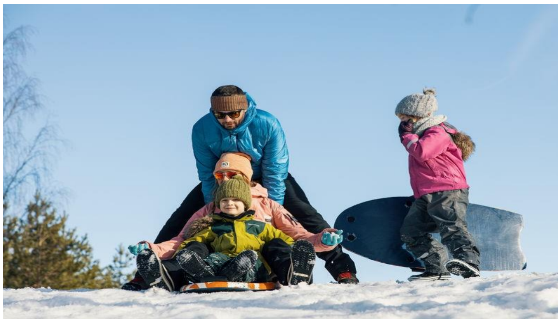
Kuva 4. Mies työntää vauhtia kahdelle lapselle mäenlaskussa. Yksi lapsi seisoo takana ja odottaa vuoroa.

henkilöstöä velvoittavat myös säännökset, jotka koskevat sosiaalihuoltopalveluihin ohjaamista ja lastensuojeluilmoituksen tekemistä 61 .