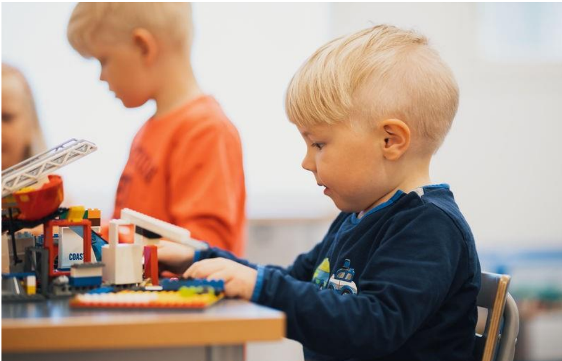
Kuva 14. Lapset leikkivät Legoilla pöydän ääressä.

Ryhmän kielellinen ja kulttuurinen monimuotoisuus tulee tehdä näkyväksi toiminnassa. Kaikissa yksiköissä toteutetaan kielirikasteista toimintaa ryhmässä esiintyvillä kielillä Vaasan kielistrategian mukaisesti.