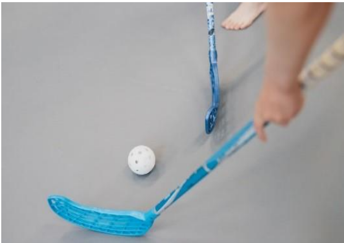
Kuva 19. Mailat ja pallo sähköpelissä.

Teknologiakasvatuksessa painotamme arjen teknologiaratkaisuja. Tutkimme esimerkiksi kumisaapasta.