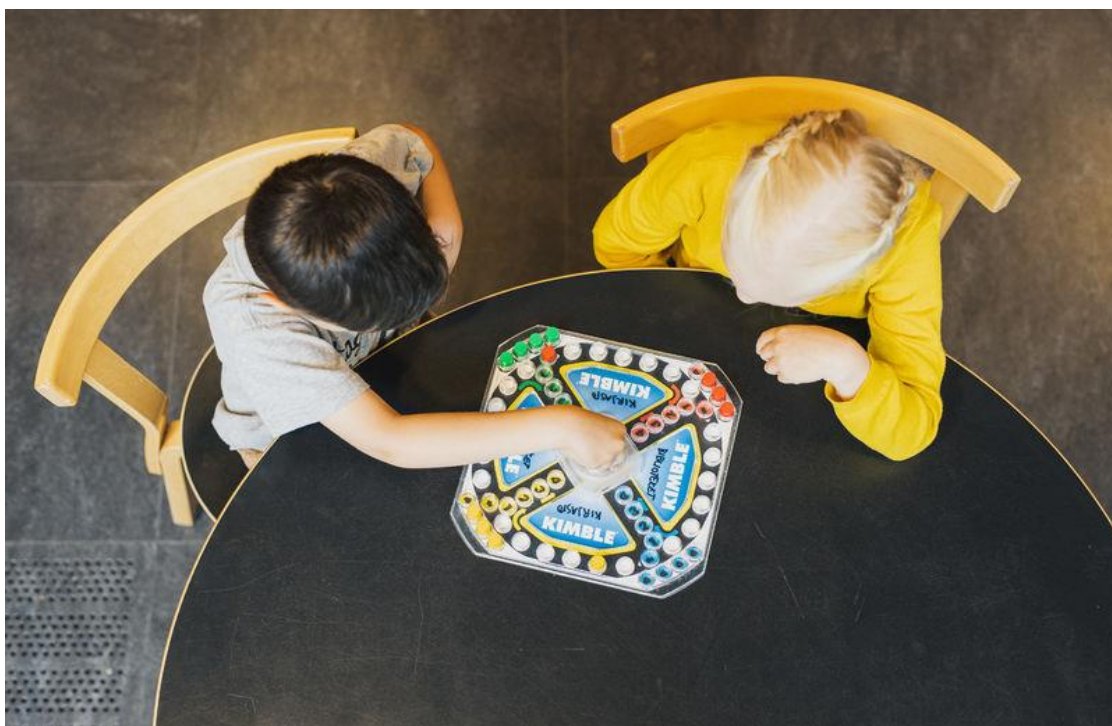
Kuva 27. Kaksi lasta istuu pöydän vieressä. He pelaavat Kimble-peliä.

Perusteena hallintopäätöksen tekemiselle lapsen varhaiskasvatussuunnitelmasta on käytävä ilmi lapselle annettava tuen taso, tukimuodot ja -palvelut sekä varhaiskasvatyksikkö. Lisää hallintopäätöksen tekemisestä luvussa 5.6.