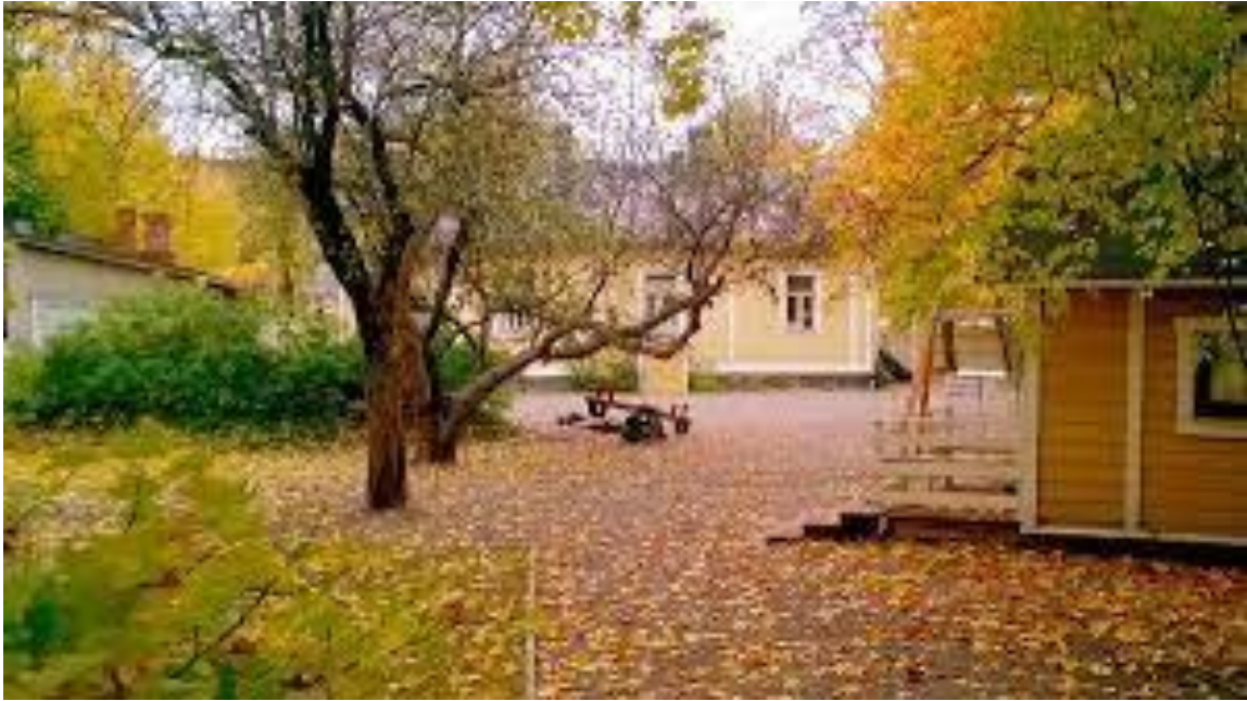
Kuva 30. Steiner päiväkoti piha-alueineen.