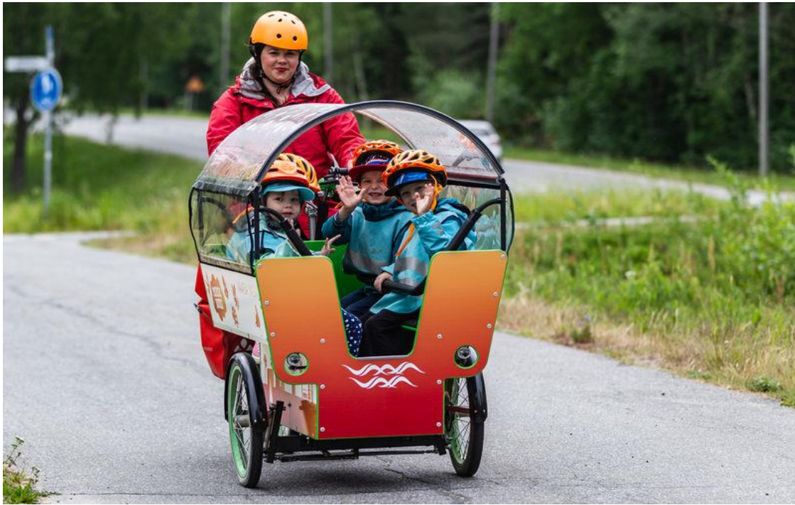
Kuva 21. Aikuinen ajaa muksubussia, jonka kyydissä on kolme lasta.