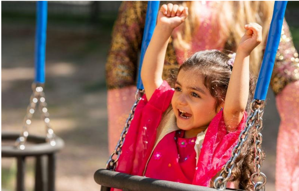
Kuva 20. Värikkäisiin vaatteisiin puettu lapsi istuu keinussa. Hänellä on kädet ilmassa.