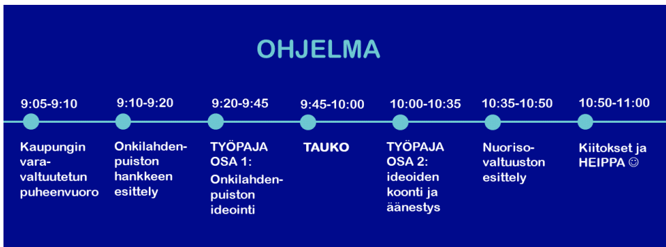
Kuva 7. Lasten vaikuttamispäivän ohjelma 27.10.2022.

Nuorisovaltuuston sekä varakaupunginvaltuutetun lisäksi myös kaupungin Lapsiystävällinen kunta -koordinaattorin sekä kulttuuri- ja sivistyspalveluiden lasten yhteisöpedagogin kanssa.