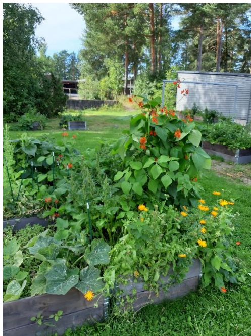
Kuva 1. Ronja Juola, Vaasan kaupunki.