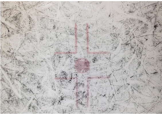
RINK, 2022, Fält & Valkonen in collaboration with Mancianti, Saarinen & NoU Ringette SM.

Mitä vierailulta jäi mieleen? Äänestä suosikkiteostasi tai tehtävääsi!