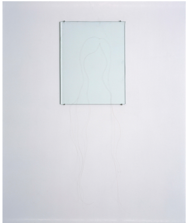
Markus Tuormaa, Muotokuva III / Porträtt III / Portrait III (2004). Hiukset, lasilevy / hår, glasskiva / hair, glass tile, 23,7 x 18,5 cm.