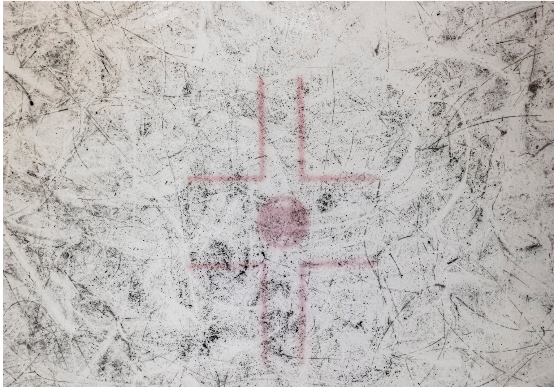
RINK, 2022, Fält & Valkonen in collaboration with Mancianti, Saarinen & NoU Ringette SM.