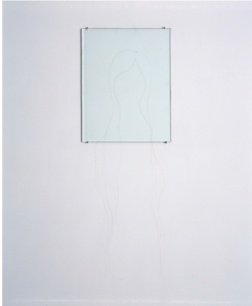
Markus Tuormaa, Muotokuva III / Porträtt III / Portrait III (2004). Hiukset, lasilevy / hår, glasskiva / hair, glass tile, 23,7 x 18,5 cm.