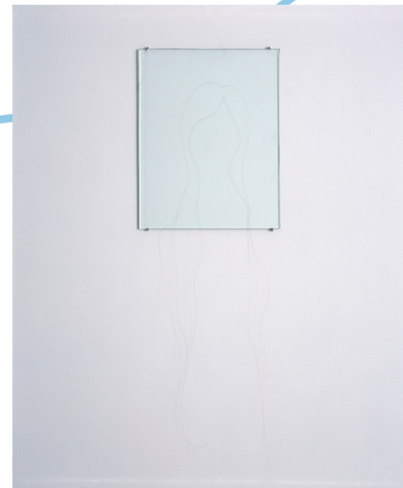
Markus Tuormaa, Muotokuva III / Porträtt III / Portrait III (2004). Hiukset, lasilevy / hår, glasskiva / hair, glass tile, 23,7 x 18,5 cm.