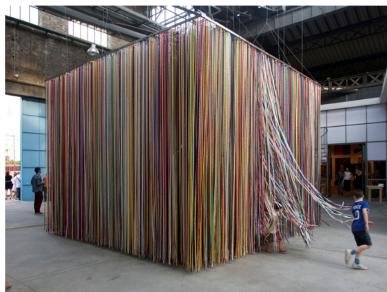
Jacob Dahlgren, The Wonderful World of Abstraction / MAGASIN – Centre National d'Art Contemporain, Grenoble, 2016.