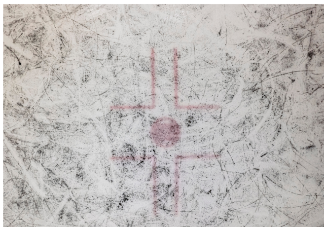
RINK, 2022, Fält & Valkonen in collaboration with Mancianti, Saarinen & NoU Ringette SM.

Mitä vierailulta jäi mieleen? Äänestä suosikkiteostasi tai tehtävääsi!