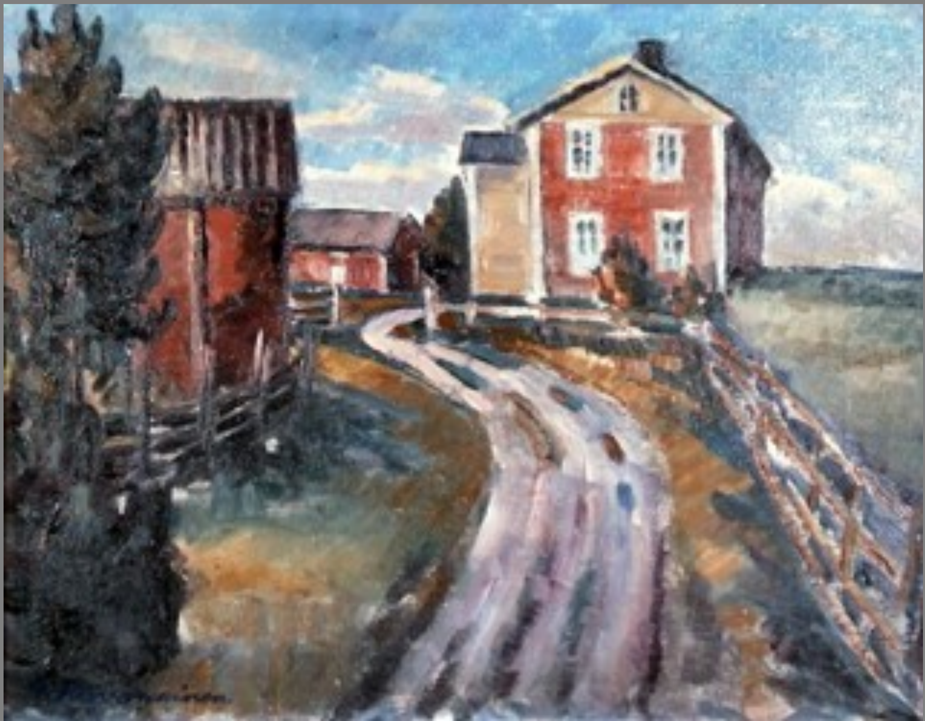
Maisema Vähstäkyröstä ♦ Landskap från Lillkyro