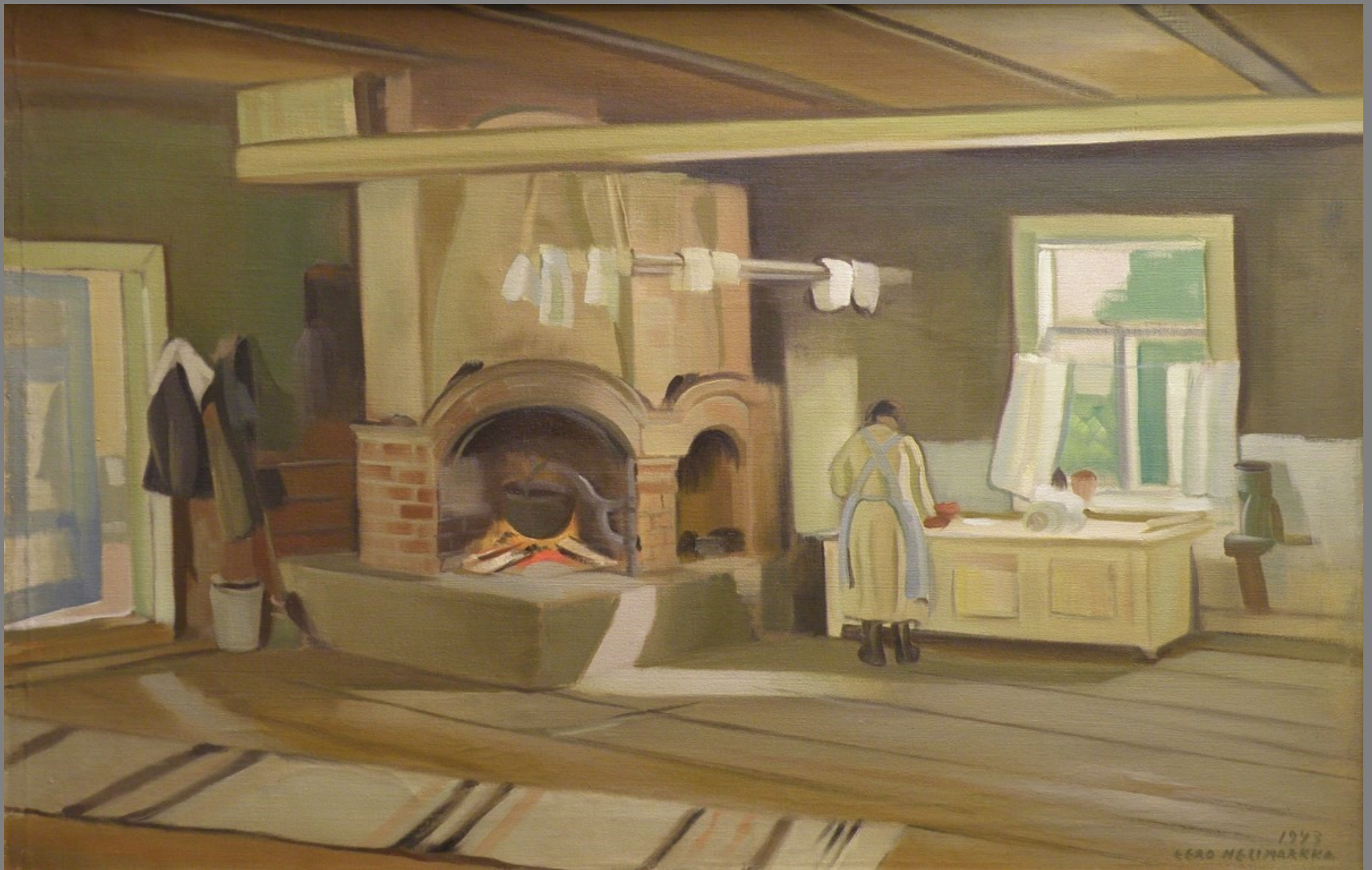
Interiööri Jaakko Matintuvan talosta ♦ Interiör från Jaakko Matintupas stuga Eero Nelimarkka, 1943, öljy/olja, 65x100, Pohjanmaan museo/Österbottens museum