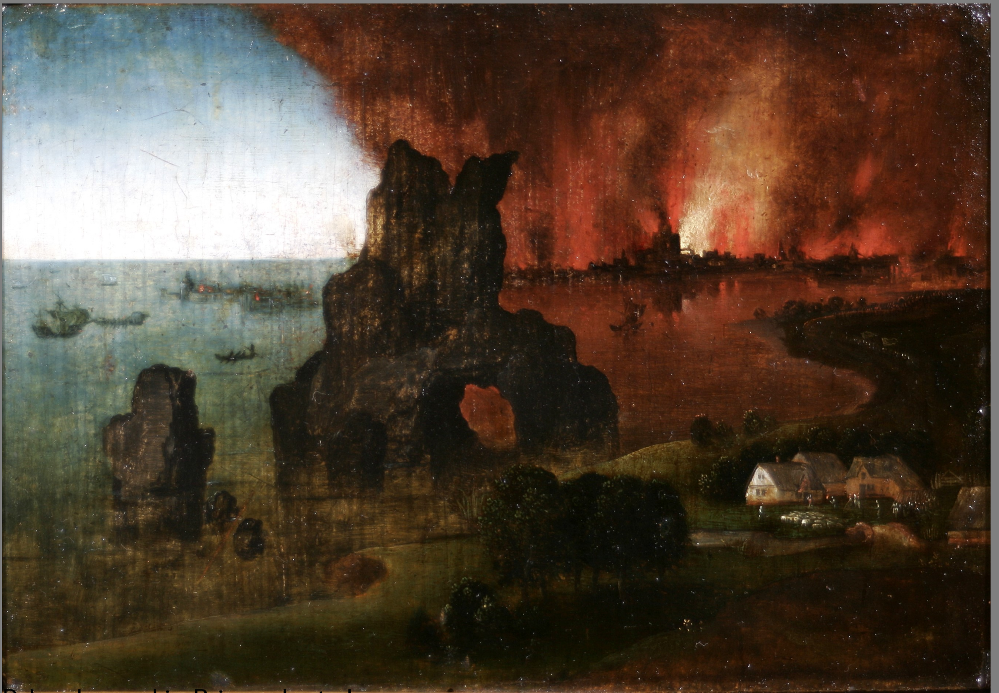
Palava kaupunki ♦ Brinnande stad

Herri met de Bles, 1530-1550, öljy/olja 12,2x17,17