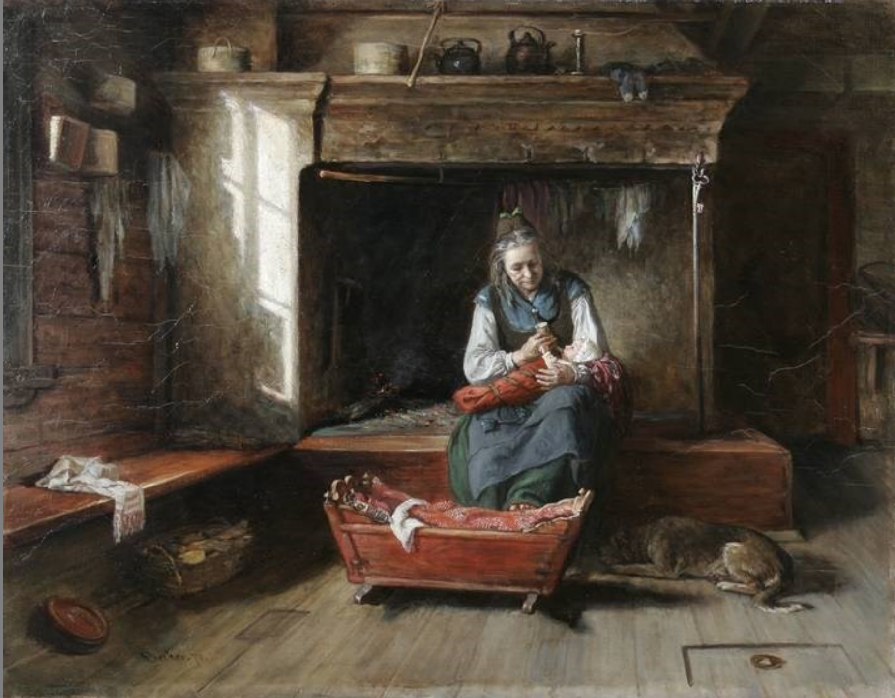
Pienokaista syötetään/Tiukkalainen interiööri / Orpo ♦ Lillan matas/Interiör från Tjock,