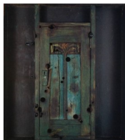
Ett återkommande motiv i Juhani Harris verk är bland annat stängda portar. För konstnären kom porttemat att betyda en väg till det okända och den vägen undersökte Harri även mer omfattande i sin konst. ( Juhani Harri, Port , 1970)

Juhani Harri (1939–2003) använder sig av föremål i sin konst. Hans verk har kallats för assemblage. Med hjälp av föremål och delar av föremål kan man skapa olika stämningar. Hur är stämningen i dessa verk?